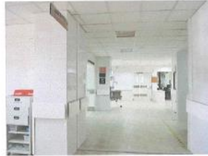
Tabla N° 2