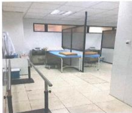
Tabla N° 5