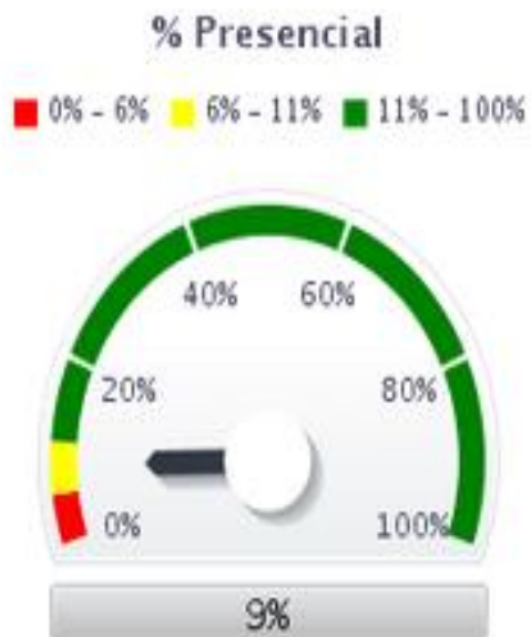
Indicador Concedidos por mes tiempo