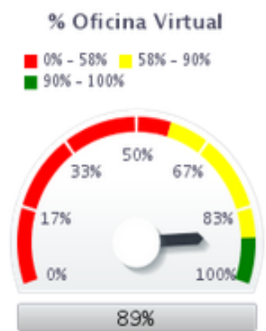
Indicador Concedidos por mes tipo