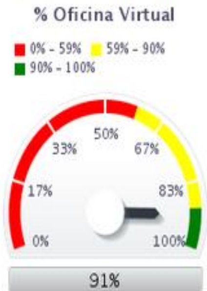
Indicador Concedidos por mes tipo