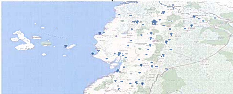
Gráfico n.º 1 Ubicación de las agencias a nivel nacional