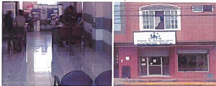
Grafico n.º 5 Situación actual publicidad