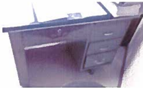
Gráfico n.º 2 Situación actual mobiliario

Actualmente las Agencias del ISSFA no cuentan con la misma imagen institucional de la Matriz, pues los muebles se encuentran deteriorados, en mal estado y de varios colores que no corresponden a los institucionales.